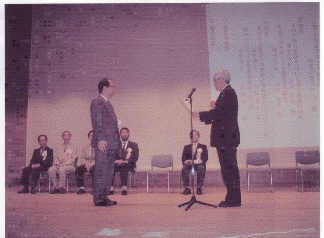
写真-2 技術賞の授与風景