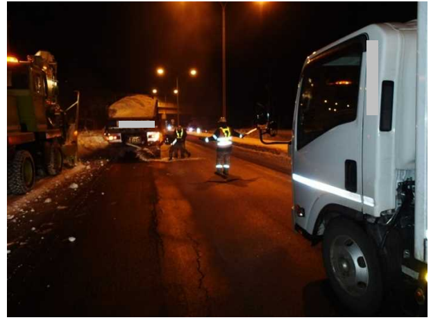
写真－１０ オーバーフロー処理作業

⑤ロータリ除雪車からの積みこぼしによる作業ロス（人力等による排除作業、交通規制）