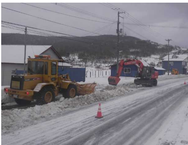
写真－3 バックハウとドーザによる巻き出し作業状況