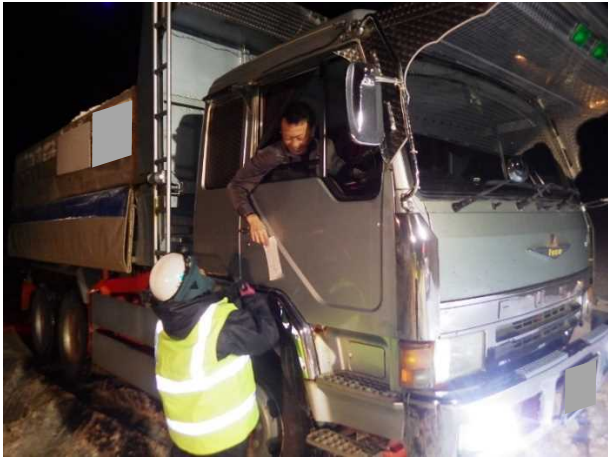
写真－８ 出入り確認状況