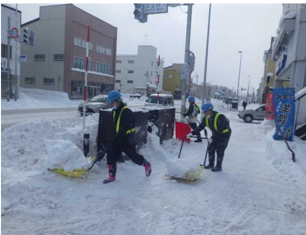
写真－１２ 人力による構造物周辺の除雪状況