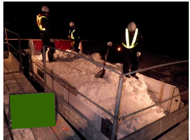
写真－６ 荷台の雪山均し作業状況

均し作業となり落下の危険が伴う非効率的な作業であることから、経験則によらない積み込み量の自動計測による把握や人力による均し作業省力化の意見があった。