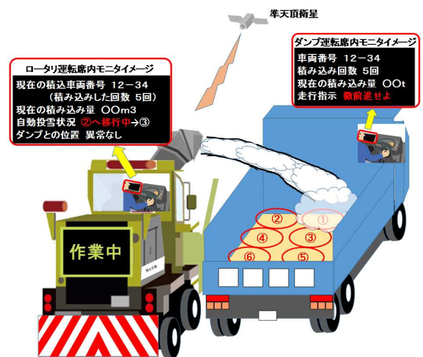
図-2 ICT化導入イメージ

本稿は運搬排雪作業へのICT導入が可能かどうかについて机上検討を行ったものであるが、今後、運搬排雪作業の効率化に向けた検討を行う予定である。(図-2)