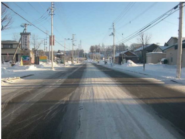
写真－2 運搬排雪作業後