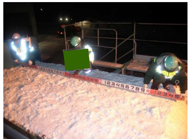
写真－７ 荷台の雪山均し後の寸法確認