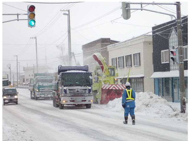
写真－4 ロータリによる運搬排雪作業状況