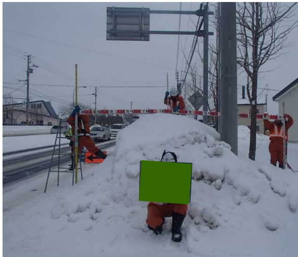
写真－５ 運搬排雪作業前の堆雪状況測量