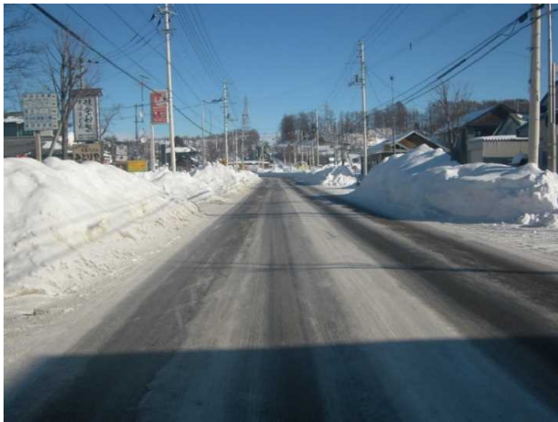
写真－1 運搬排雪作業前（堆雪状況）

数の機械や機械誘導や補助作業を行う作業員及び交通整理員となっており、他の除雪作業とは構成が大きく異なる作業（写真－3，4）であるとともに、長年に渡り機械などの構成に大きな変化が見受けられない作業でもある。