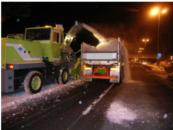
写真－９ オーバーフロー発生状況