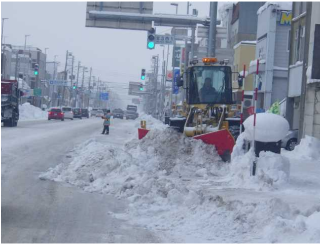
写真－１１ ドーザによる構造物周辺の除雪状況