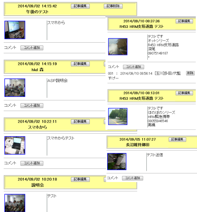
図-2 ブログUP訓練の画面

また、緊急時にスマートに活用できるようにするためには、日常的に使用することが不可欠である。