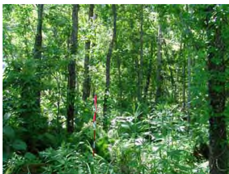
図-5 忠別川 st. 2 の稚樹