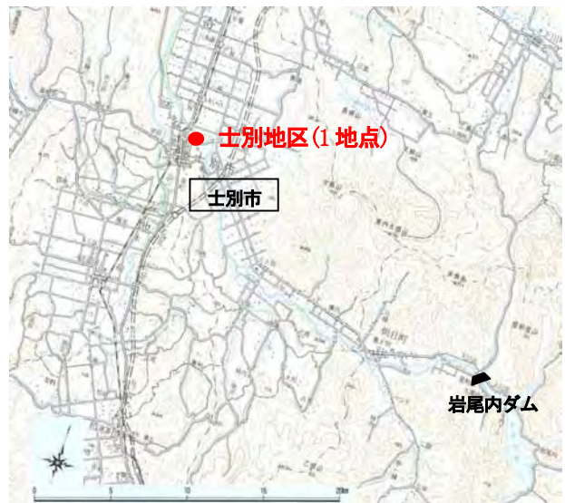
図-2 天塩川の調査地