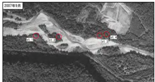
図-6 忠別川での河道変化