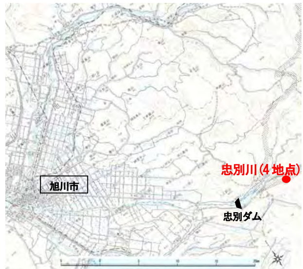
図-1 忠別川上流の調査地

現状のヤナギ類などの先駆種が優占する河畔林から目標とするかつてのハルニレ、ヤチダモが優占する発達した河畔林に遷移していくには、どのような河畔林管理を行えば良いのか、現在の河畔には、そのような発達した河畔林はほとんど残されていないことから、自然状態での河畔林の動態を把握することを目的として、林齢、林分構造、稚樹分布を調査した。これには、発達した河畔林あるいは様々な発達段階の河畔林が分布する忠別川上流と先駆林が分布する過去から人為改変の行われてきた低地帯の天塩川土別地区(KP177 付近左岸)とを比較した。