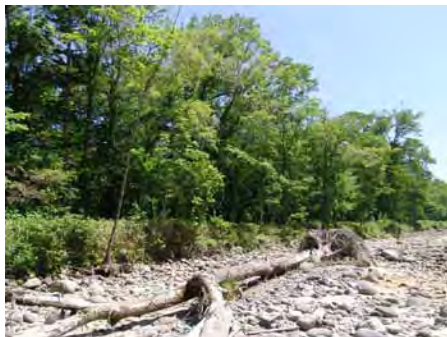
図-3 忠別川上流の調査地周辺

調査方法は、各箇所とも群落高を参考にした方形区を設定し、2008年9月29日から10月3日の期間で毎木調査、稚樹調査、林分概況調査を行なった。毎木調査は、樹高 1.3m以上の樹木を対象に、種、樹高、DBH（胸高直径）を計測した。稚樹調査は、樹高 0.2m以上の木本個体を対象に、種、稚樹高を計測した。林分概況調査は、林齢を把握するため、代表的な3個体程度に対し、地上高 30~40 cmでの成長錘による樹齢調査を行なった。また、水面からの地盤の比高を各サイトあたり3箇所計測した。