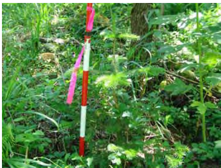
図-4 忠別川 st. 2 の林内