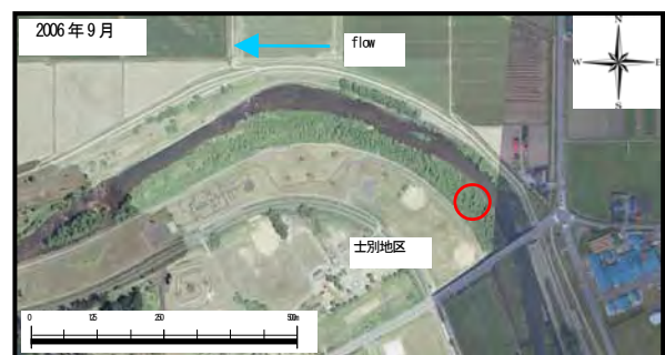
図-7 天塩川の河道状況

変化がみられず、先駆林内での稚樹は赤い実のなる鳥散布型のマユミのみであり、河畔性広葉樹の主要木となるハルニレ、ヤチダモなどの稚樹は分布していない。マユミの稚樹は樹高 50 cm 未満の個体が分布しているが、樹高 50 cm 以上に成長している個体がなく、また、更新していく兆候がみられない(図-8、天塩川士別地区)ことから、今後はおそらく高茎草本との競争関係などによりほとんどが衰退していくものと思われる。士別地区の先駆林は、林齢 25 年の先駆林であり、同様な林齢の忠別川 st. 2 と比較すると、周辺に母樹があれば次のステージの稚樹群が更新していたと思われる。