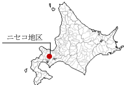
図-1 ニセコ地区位置図

ニセコ地区は、後志管内虻田郡ニセコ町に位置し、羊蹄山とニセコ連峰に囲まれ、一級河川尻別川及びその支流沿いに開けた畑作・水稻等の多様な農業を展開している地域である。(図-1)