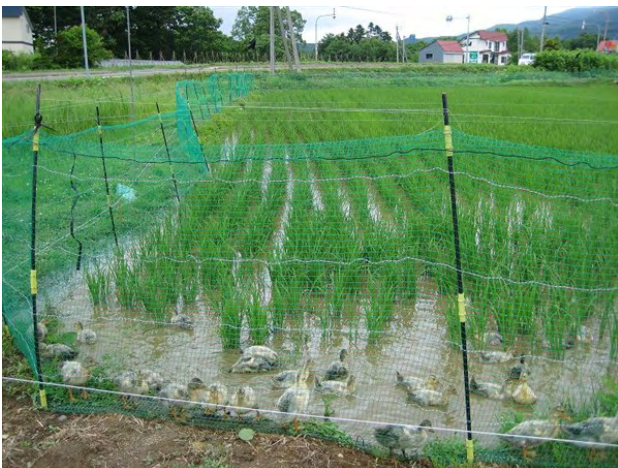
写真-2 アイガモ農法

このような恵まれた自然環境を背景に、ニセコ町では、高品質で安全性の高い農業の実践を目指す「地域循環型クリーン農業」が推進されており、アイガモ農法による水稲栽培（写真-2）や畜産農家から排出された糞尿を堆肥センターで堆肥化し、ほ場に還元する減農薬農業が実践されている。