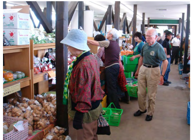
写真-3 道の駅「ニセコビュープラザ」

これらクリーン農業で生産された農作物は、道の駅「ニセコビュープラザ」の直売所において販売されており、多くの観光客が訪れ賑わいをみせている。（写真-3）