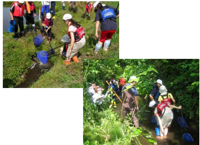
写真-4 生物調査状況

排水路内の流水を採取し、水温及びpHの測定を行うとともに、水路内では浮きを用いて流速を測定した。