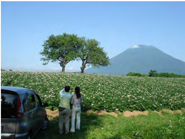
写真-1 雄大な農村景観を形成する丘陵地の「さくらんぼの木」